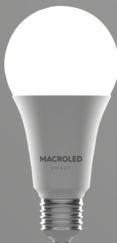
A60 - 12W