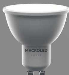
GU10 - 5W